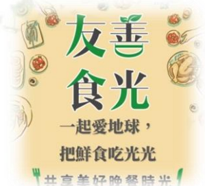
友善食光不浪費優惠活動