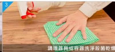
3 調理器具或容器洗淨殺菌乾燥