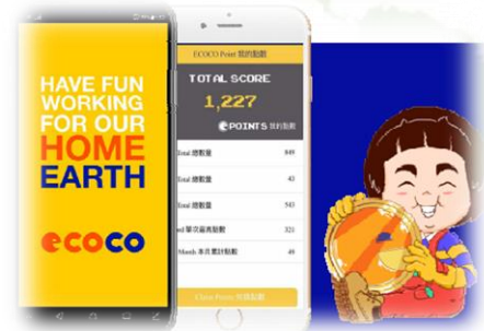
結合ecoco環保智能機活動回饋