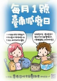
持續響應環保減廢優惠