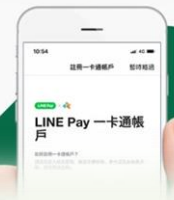
全面導入一卡通實體支付/ LINE PAY行動支付