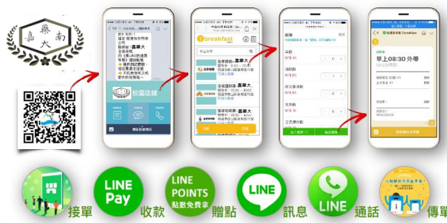
全面導入線上APP點餐系統