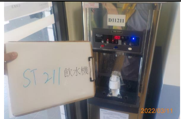
ST 211 飲水機