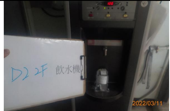
D2 2F 飲水機