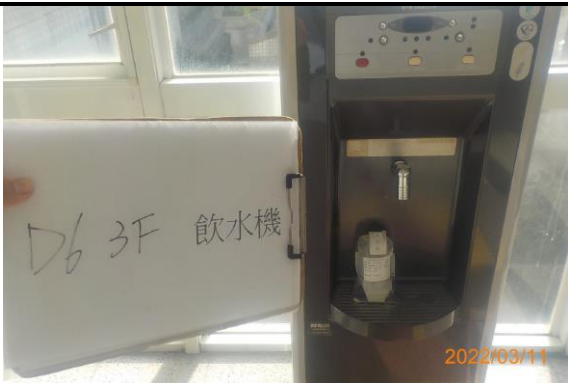
D6 3F 飲水機