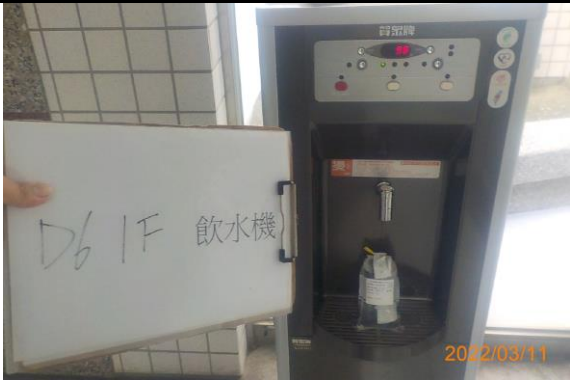
D6 1F 飲水機