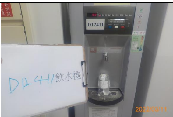
D12 411 飲水機