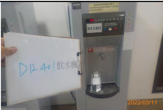
D12 401 飲水機