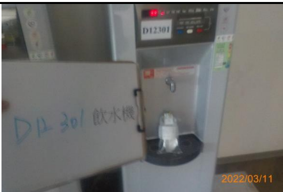
D12 301 飲水機