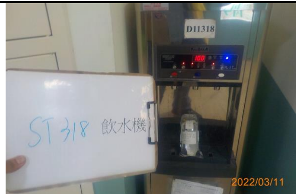
ST 318 飲水機