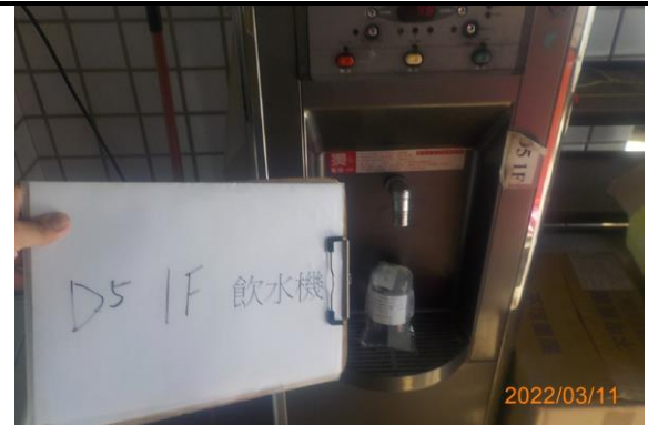
D5 1F 飲水機