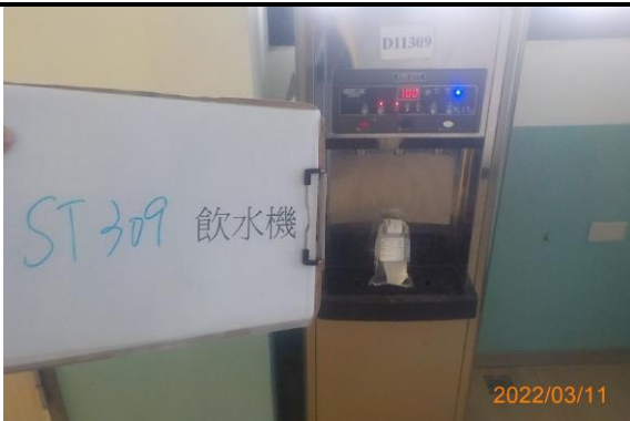
ST 309 飲水機