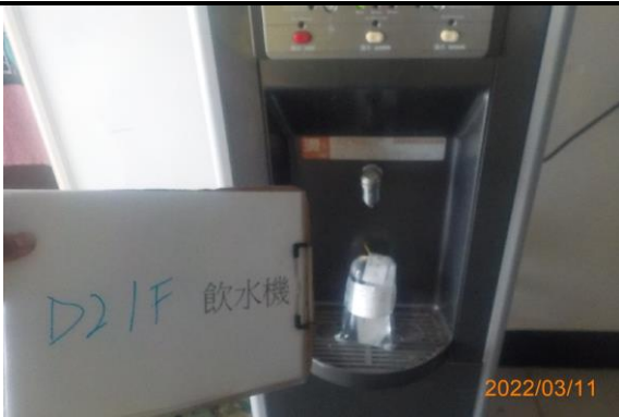
D2 1F 飲水機