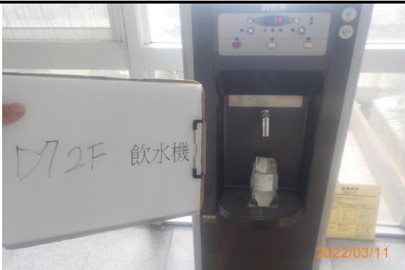
D7 2F 飲水機