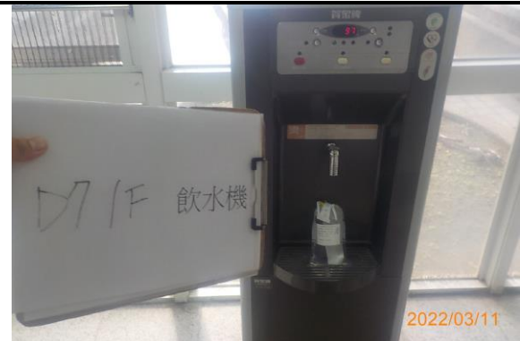
D7 1F 飲水機