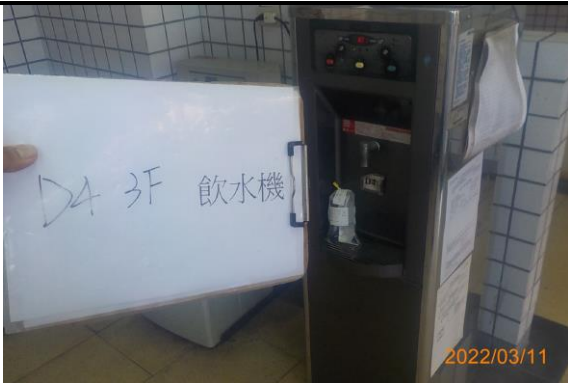
D4 3F 飲水機