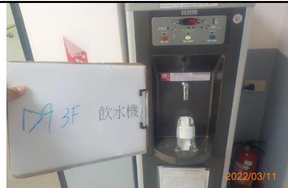
D9 3F 飲水機