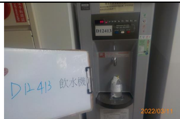
D12 413 飲水機