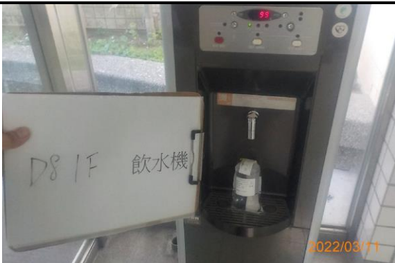
D8 1F 飲水機