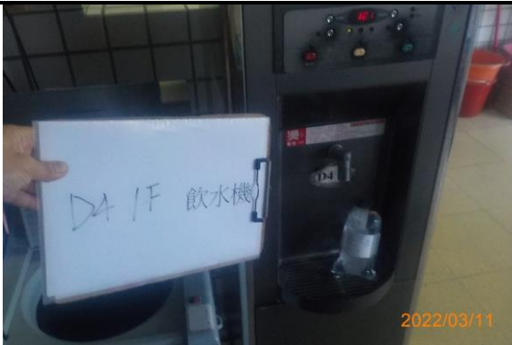
D4 1F 飲水機