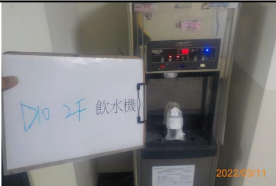
D10 2F 飲水機