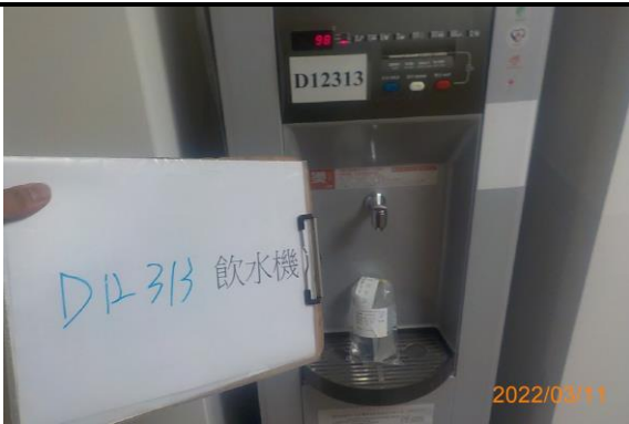
D12 313 飲水機