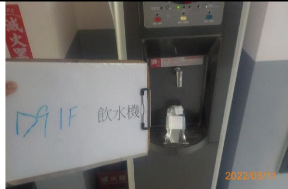
D9 1F 飲水機