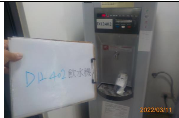
D12 402 飲水機