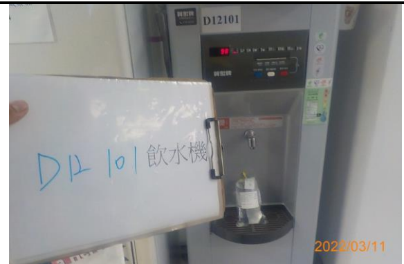
D12 101 飲水機