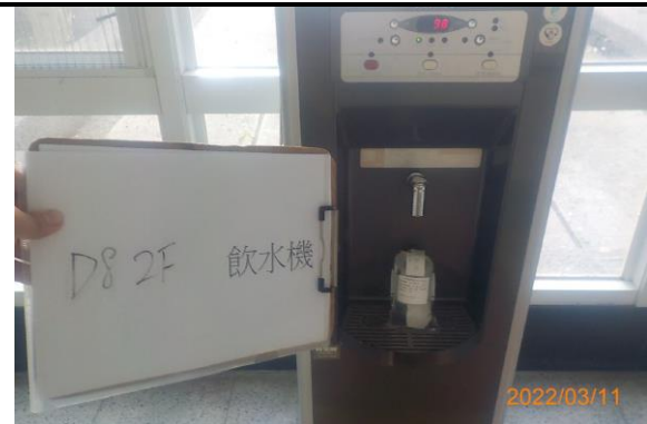
D8 2F 飲水機