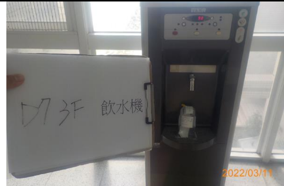
D7 3F 飲水機