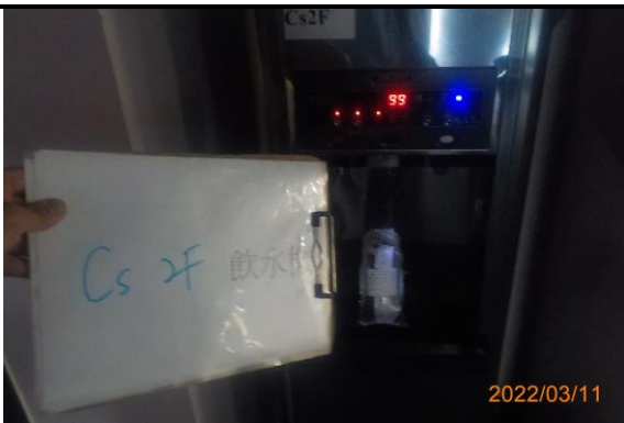
Cs 2F 飲水機