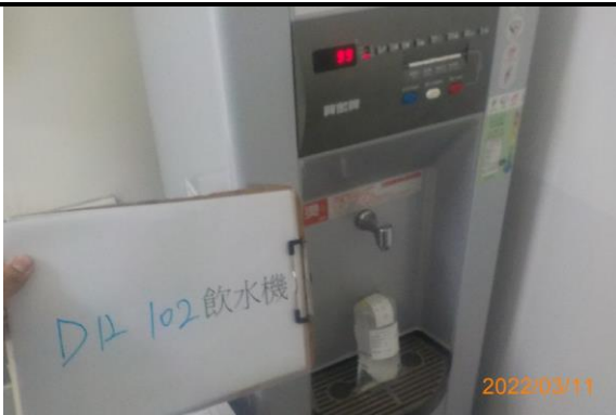
D12 102 飲水機