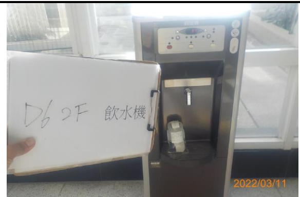
D6 2F 飲水機