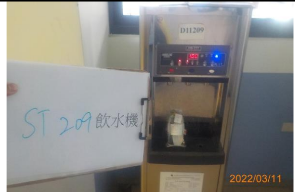
ST 209 飲水機