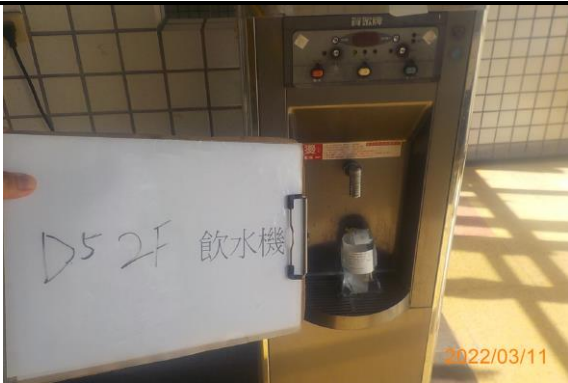
D5 2F 飲水機