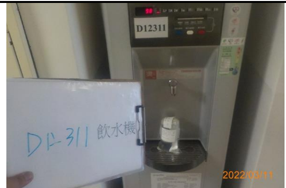
D12 311 飲水機