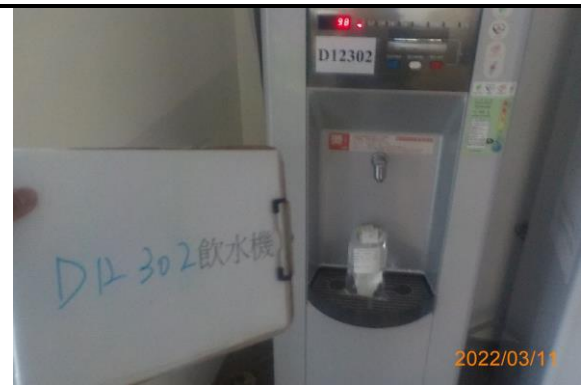
D12 302 飲水機