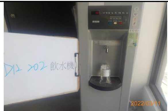
D12 202 飲水機