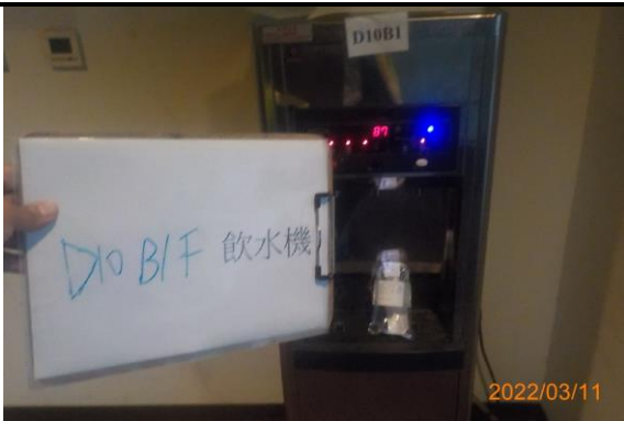
D10 B1F 飲水機