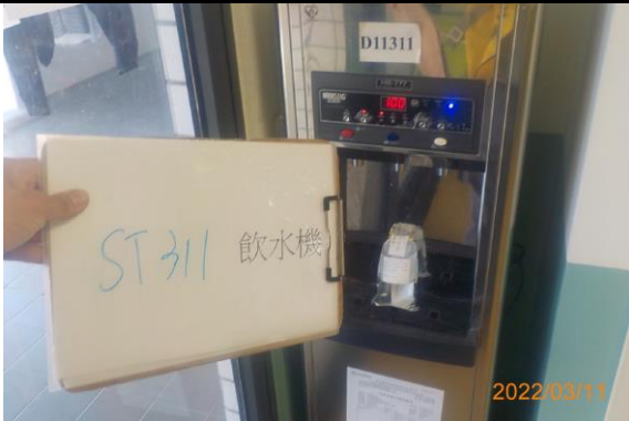
ST 311 飲水機