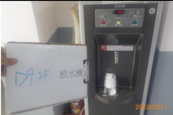
D9 2F 飲水機