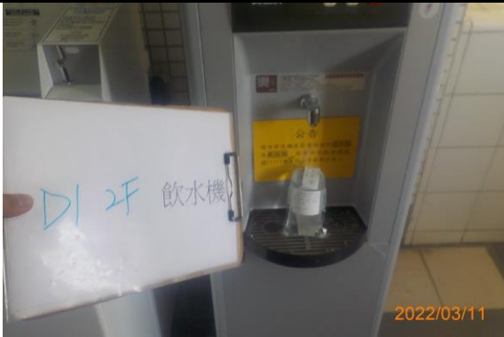
D1 2F 飲水機