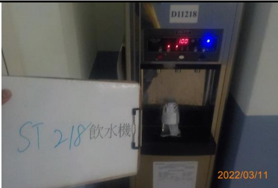
ST 218 飲水機