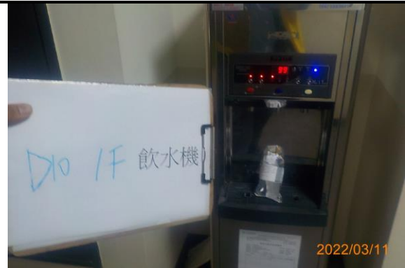
D10 1F 飲水機