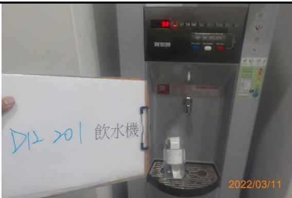
D12 201 飲水機