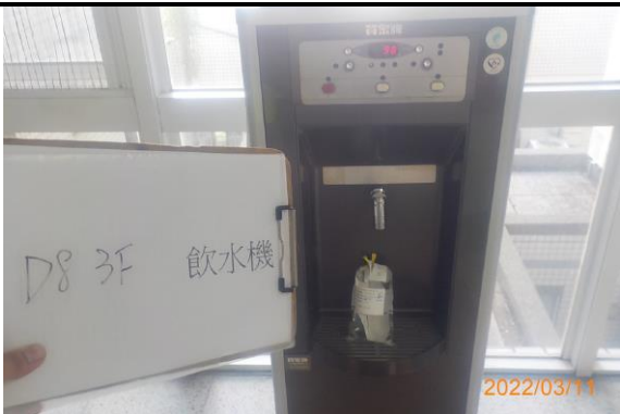
D8 3F 飲水機