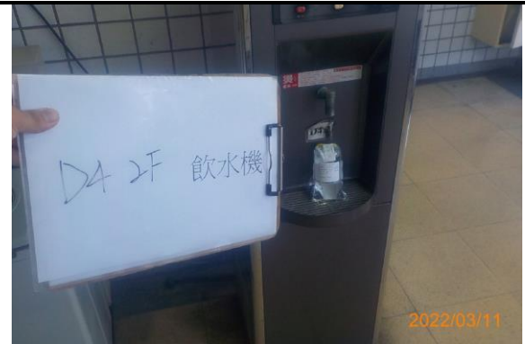
D4 2F 飲水機