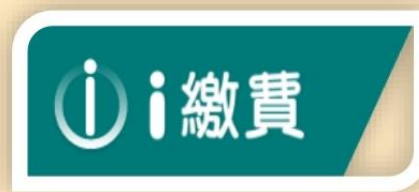
信用卡線上繳費平台(i繳費)