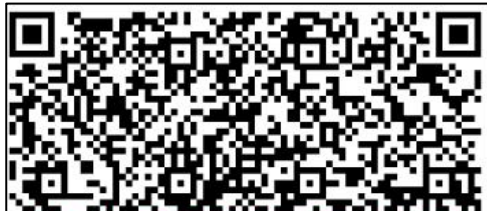
學士服歸還切結書