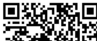
校車繳費申請系統